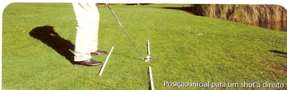
Posição inicial para um shot à direita.

Uma análise de vídeo ao swing também é recomendável. Permite-lhe compreender mais facilmente as eventuais mudanças que terá de fazer no movimento.