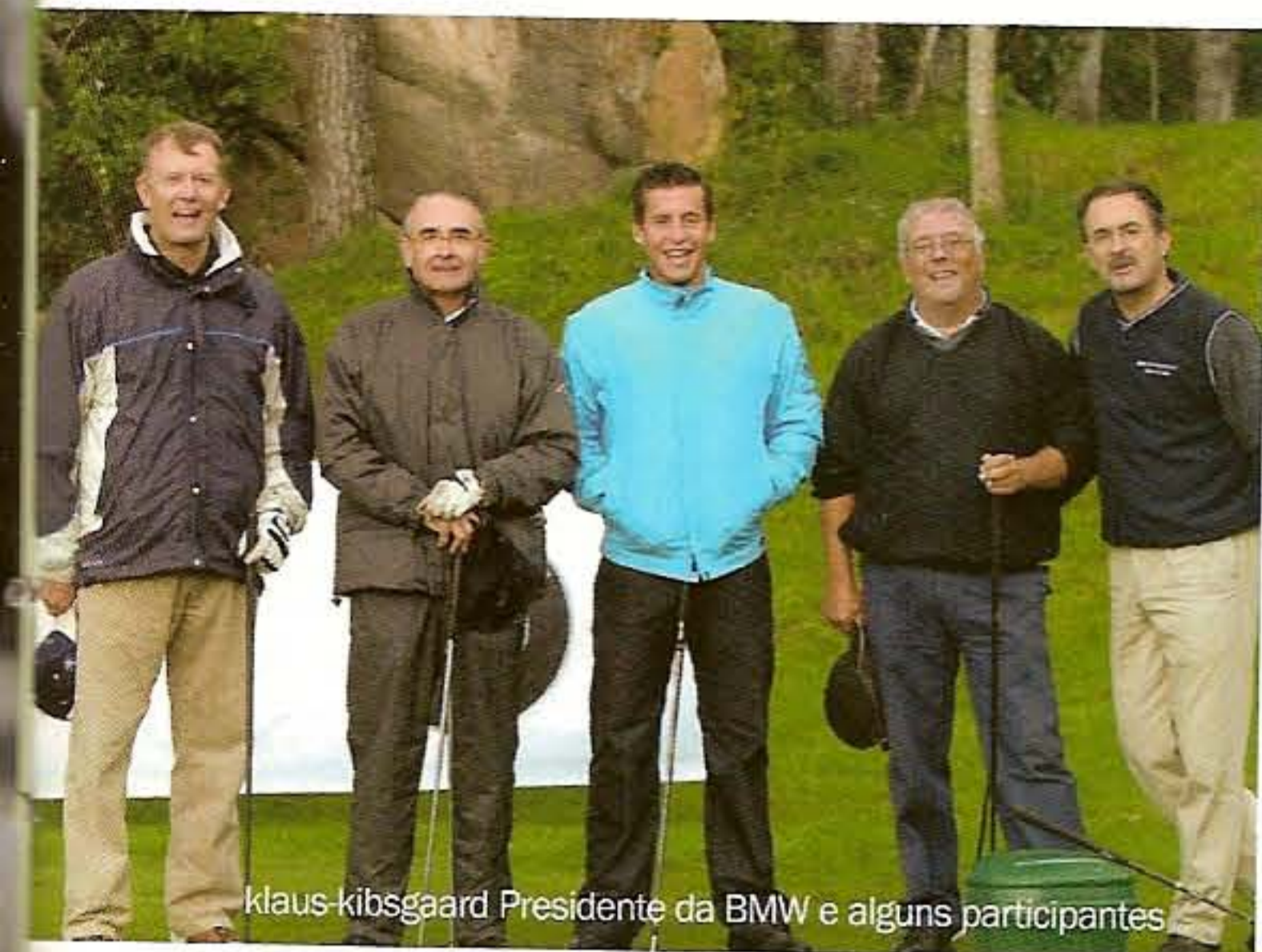
klaus kibsgaard Presidente da BMW e alguns participantes