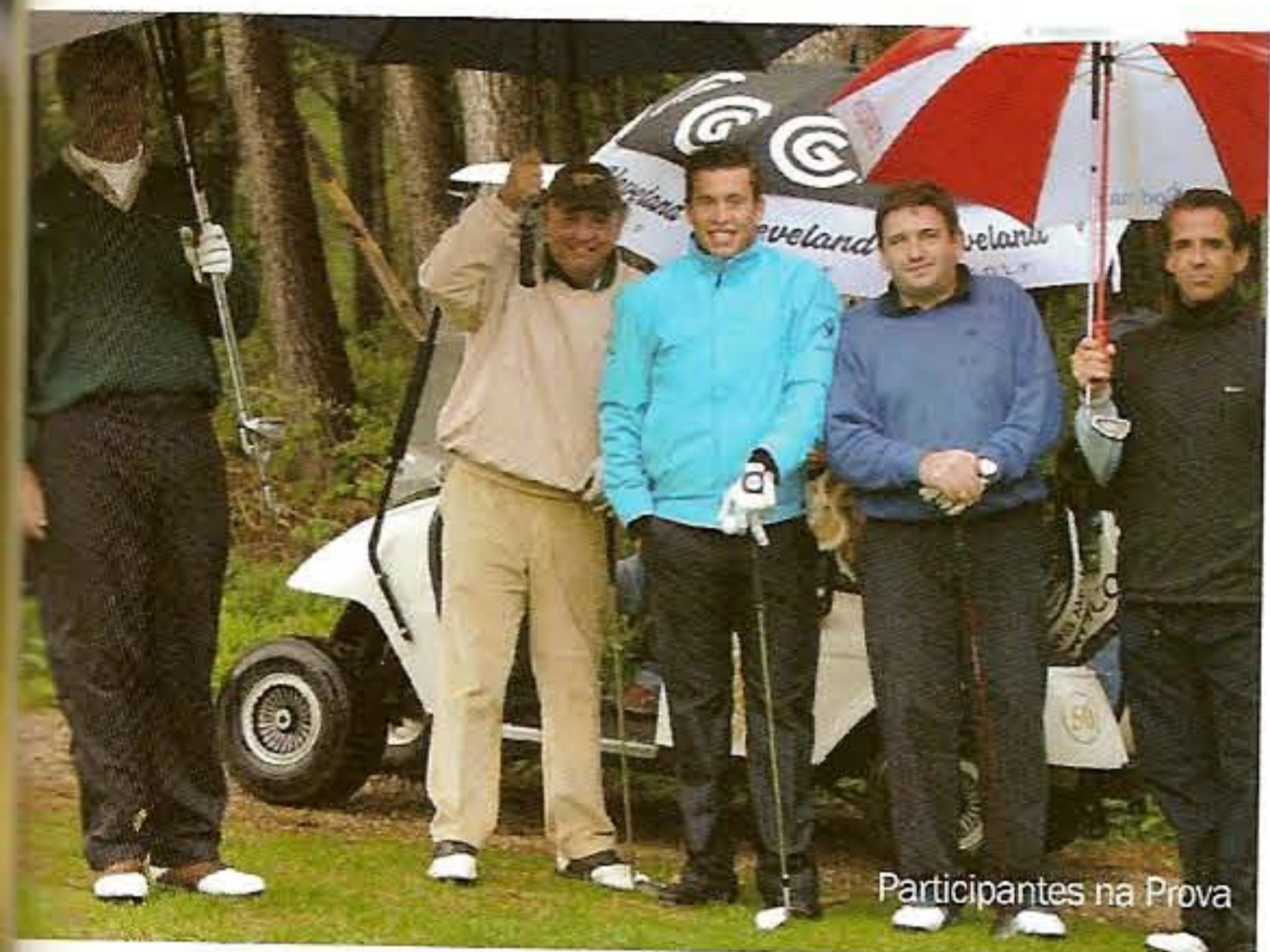
Participantes na Prova

funções de Embaixador dos EUA, em Portugal, assumindo-se como uma das figuras políticas mais influentes no país.